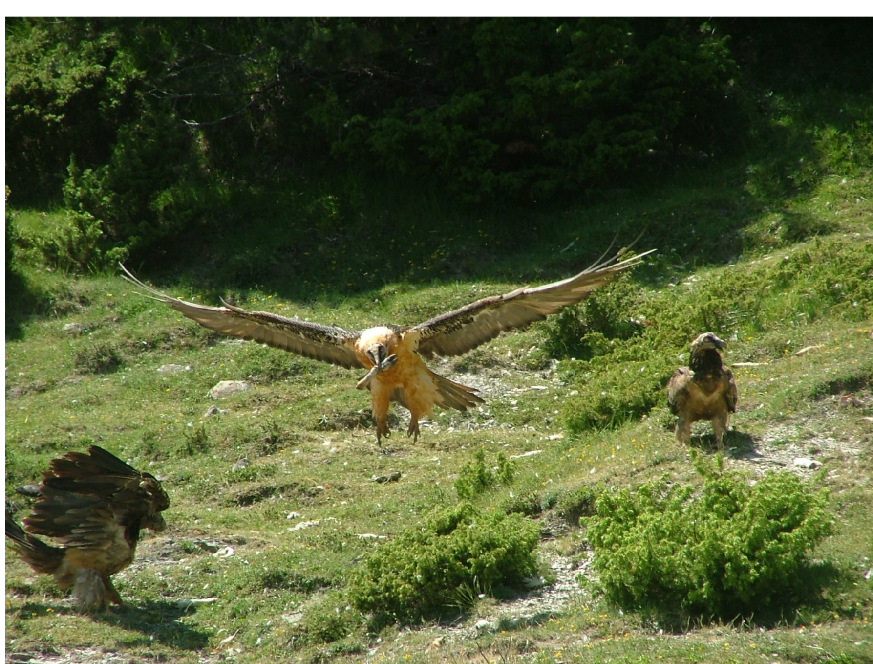
Abb. 3: Bartgeiernahrung besteht bis zu 90% aus Knochen. In der Bildmitte ein Altvogel, links und rechts noch nicht geschlechtsreife Tiere, erkennbar am dunklen Kopf.

Der Nationalpark Hohe Tauern bedankt sich herzlich!