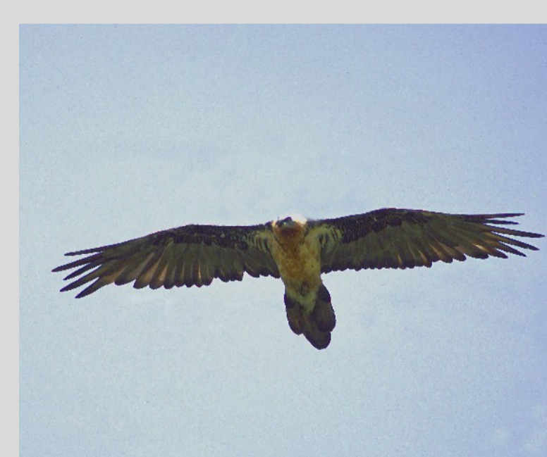
Abb. 4: Altvogel